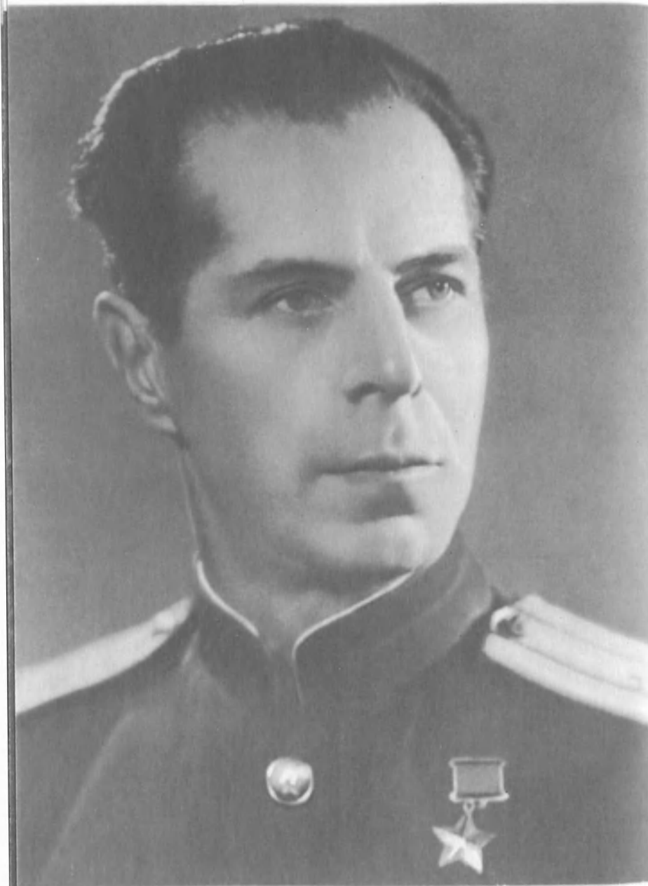
Командир партизанского отряда Герой Советского Союза Дмитрий Николаевич Медведев (см. «Медведевцы в Ровно»).