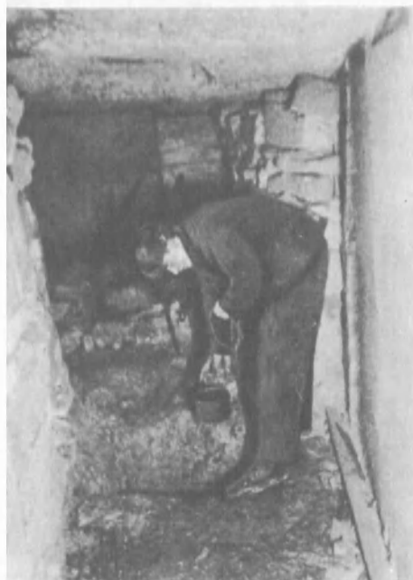
Колодец в катакомбах [см. «Всегда с народом»].