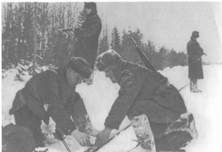
«Рельсовая война». Бойцы оперативно-чекистской группы готовят взрыв железнодорожного полотна, чтобы сорвать подвоз к фронту живой силы и техники противника (см. «Невидимый фронт»).