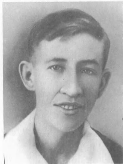
Костя Феоктистов. 1942 год [см. «Ради человека»].