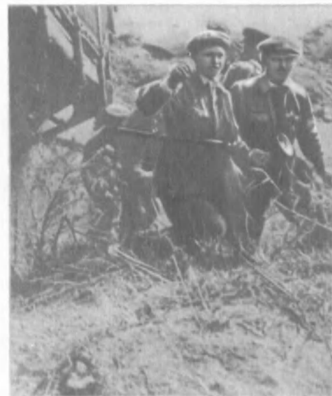
Бойцы подрывной группы после выполнения боевого задания возвращаются на свою базу (см. «В поединке с врагом»).